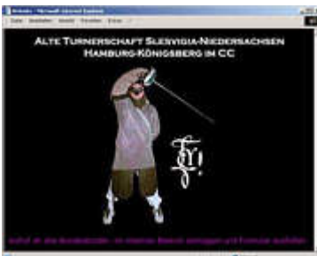
Website der Turnerschaft Slesvigia: Alles über die Mensur

In der Welt der Verbindungsstudenten werden noch echte Zweikämpfe mit scharfen Waffen ausgetragen, bis deutsches Blut spritzt. Nach der Mensur preist man den "Kick" und vergleicht stolz die Schmiss, besingt schwarzbraune Haselnüsse und trinkt viel Bier. Sehr viel Bier. Eine Reportage von Max Schulz